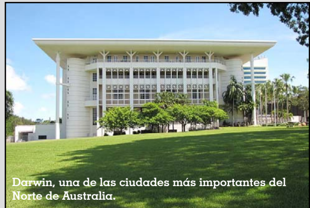
Darwin, una de las ciudades más importantes del Norte de Australia.